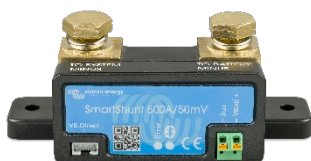
Deteção Bluetooth: SmartShunt