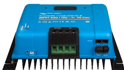
Controlador de Carga SmartSolar MPPT 250/100-Tr VE.Can sem ecrã