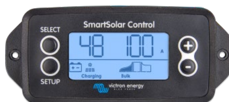
Ecrã conectável SmartSolar