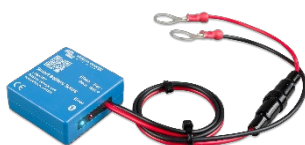
Deteção bluetooth: Sensor de bateria inteligente