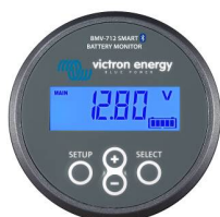
Deteção bluetooth: Monitor de Bateria BMV-712 Smart